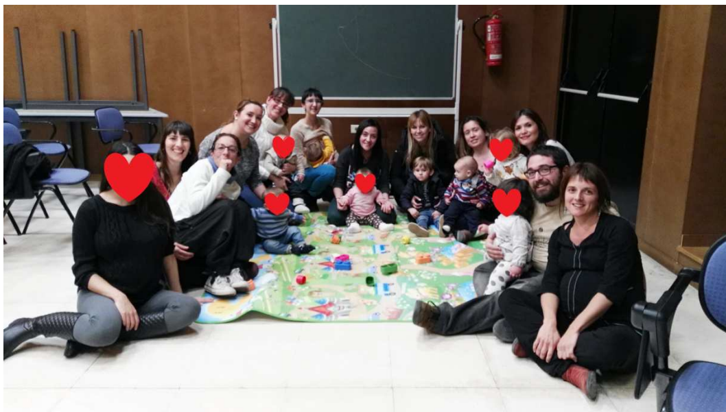
I el resultat final.